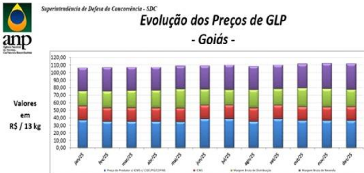
Gráfico da ANP Ano de 2025.

Fonte: Relatório do Mercado de Derivados de Petróleo/MME